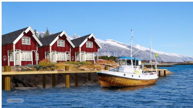
Fotomontasje hytter og sjøhus: Rana Hytta